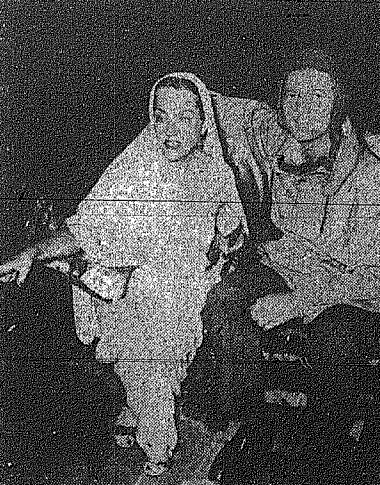
Η Γκλόρια Σβάνσον κ' ο άνδρας της...