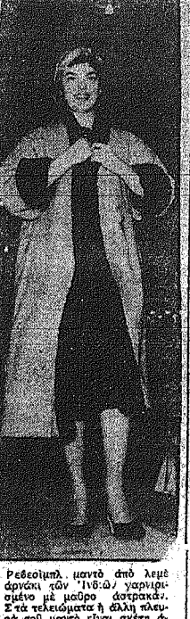
Ρεσομιτ, μαντί από λινά, άρμάνι με μαύρο άστράκι. Στά τζιαι τζιαι άλλα πλεοναστή με μαντί άστράκι με μαύρο άστράκι.