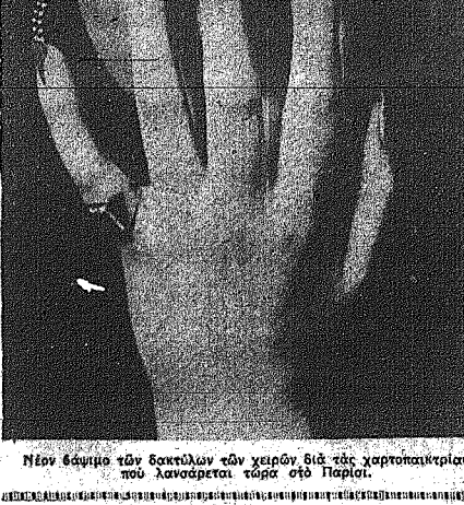
Νέον εδωκτο τόν έδωκτικόν τών γερών διά τήν χαρτοπαίγνιαν, που λανθάρει τάρη στο Παρίσι.