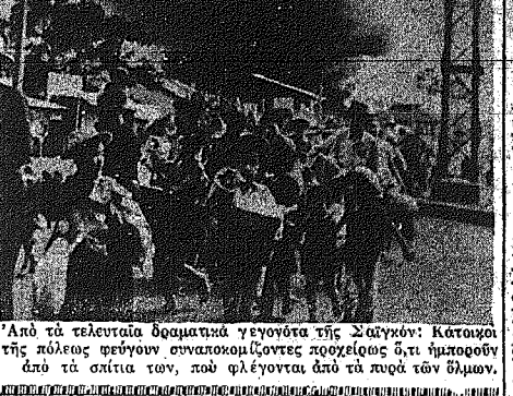
Από τα τελευταία δραματικά γεγονότα της Σαγγαίνης. Κατακλιθείς πόλεμος φέρων συνολικόντες χορηγούς, δει μιμνήσκοντες από τα σκίτσια των, που φιλόντοια από τα παρά τον θύμον.

Νίνου Μικελλάου «ΠΡΩΤΑ ΣΤΕΡΟΥΓΙΣΜΑΤΑ» (Κύπρος, 1955)