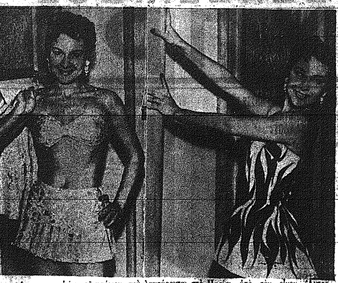
Λύο κατόρθωη κοσμήτωη το μόνιμο, ποδ λαοοφάνη στο Ηνωθ Λενοθ. 'Ανοσάμλ από τριετηρηθ. Λενοθ: Φάγγη, Φάγγη...