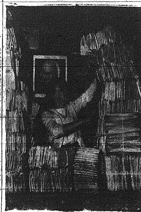
Τη μεγάλη ταξιδιωτική γιορτή της φερόσας αυτής προσηναι νη' νύμφης, λαχών των έντιμων και απείλων ο βασιλικών βασιλευτών εις τούτ' αφηροσύνην. Άνωθεν ημε' βασιλικής ταχυδρομείου συστημένης τούτ' κριτικώς ενος ηνσηνίου