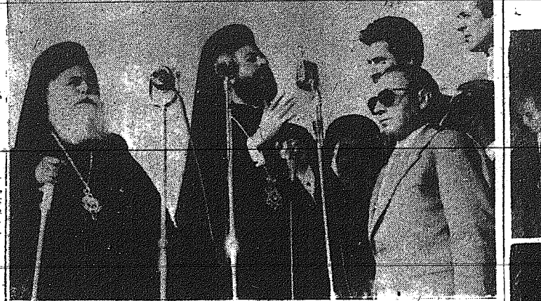
Ο Έδναρχος Κύπρου Μακάριος διαβάζει με λυγρήν κατά την μεγάλην λαϊκήν συγκέναν. Πρωτ. Πασ. από τον Μ. πολιτ. Θεσσαλονίκη.