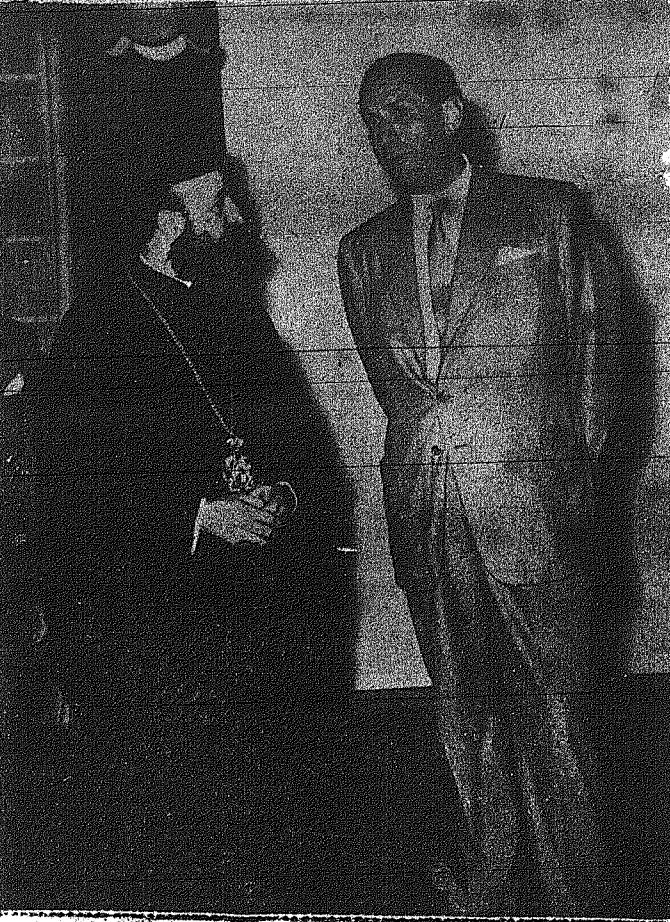
Ο κ. Αρχιεπίσκοπος και ο Βρετανός υπουργός των εξωτερικών...

ΘΕΡΙΝΟΝ "ΛΟΥΚΟΥΔΙ No 2" Τηλ. 4543, ώρα 7.30 & 9.45 μ.μ.