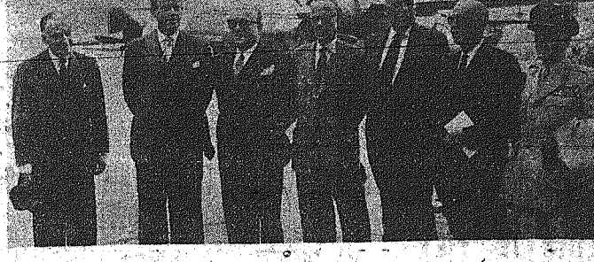
ΑΠΟ ΤΗΝ ΑΦΙΞΗ ΤΗΣ ΕΛΛΗΝΙΚΗΣ ΑΝΤΙΠΡΟΣΩΠΕΙΑΣ ΕΙΣ ΤΗΝ ΑΕΡΟΔΡΟΜΟΝ ΤΟΥ ΛΟΝΔΙΝΟΥ... Ο αντιπρόσωπος της Ελλάδος κ. Στ. Στεφανόπουλος...