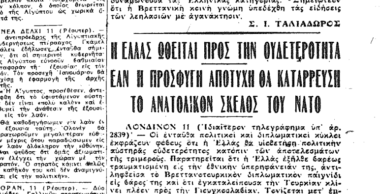
Ο βασιλεύς Παύλος...