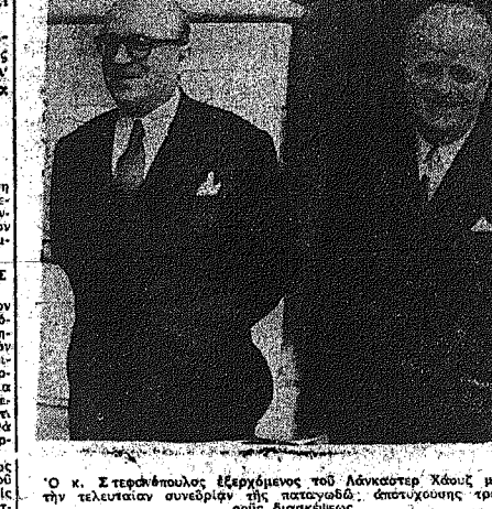
Ο Κ. Στεφανουπόπουλος...