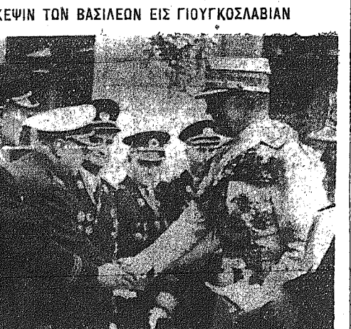
Ο βασιλεύς Παύλος...