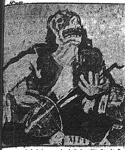
Η Γιουγροσλαθική ξωγραφική τέχνη διεκρίθη έξε την διε Μαν του Σαν Πάσλο. Το ανωτέρω έργον του Γιουγροσλάδου ζωγράφου Πέτας Λουμπάρδα έδοαδεύθη