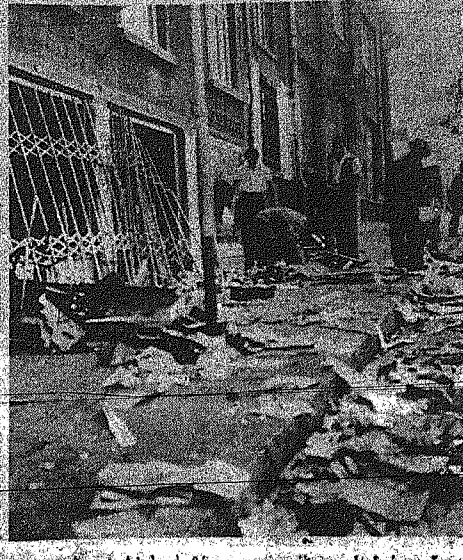
Έρεδαα, συντρίμματα και πλήρης λεηλασία των Ελληνιών καταστημάτων! Αδτό τό θέαμα παρουσιάζουν οί δρόμοι δικου υπίσχον Ελληνικά καταστάματα.