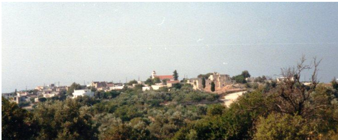
Το Χρωμοναστήρι πριν 20 χρόνια