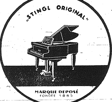
MARQUE DEPOSEE FONDÉE 1885