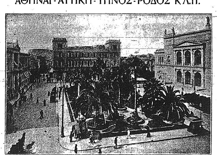
Ἡ ΠΛΑΤΕΙΑ τοῦ ΛΟΥΔΟΒΙΚΟΥ (ὅπου τὸ Δημ. Θέατρον καὶ τὸ Μέγαρον τῶν Ταχυδρομείων Τηλεγραμμῶν-Τηλεφώνων).

20 ΙΟΥΛΙΟΥ - 18 ΑΥΓΟΥΣΤΟΥ ΑΘΗΝΑΙ - ΑΤΤΙΚΗ - ΤΗΝΟΣ - ΡΟΔΟΣ Κ.Λ.Π.