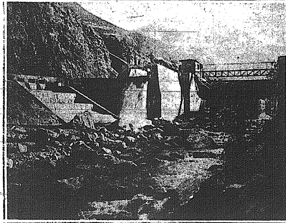
Τὸ φράγμα τὸ συγκροτοῦν τὰ ὕδατα τοῦ ποταμοῦ Γλαύκου...