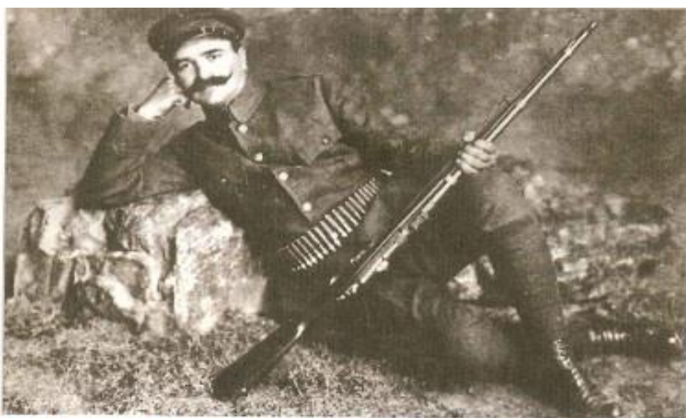
Ο Πολεμιστής Ματσούκας. Πρωτοδημοσιεύτηκε στο Περιοδικό Η Εικονογραφημένη, αρ. 107, Σεπτέμβριος 1913.