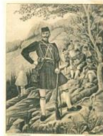
ΜΕΤΣΟ ΜΕΤΣΟ ΤΕΛΕΣΤΟ