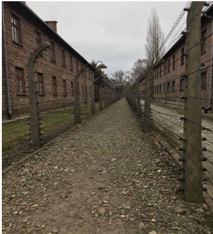
Εικόνα 4. Συρματόπλεγμα τοποθετημένο περιμετρικά του στρατοπέδου του Άουσβιτς.