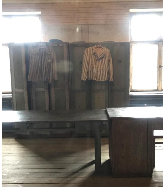
Εικόνα 9. Αποδυτήρια Γερμανών των υφιστάμενων του στρατοπέδου του Άουσβιτς.