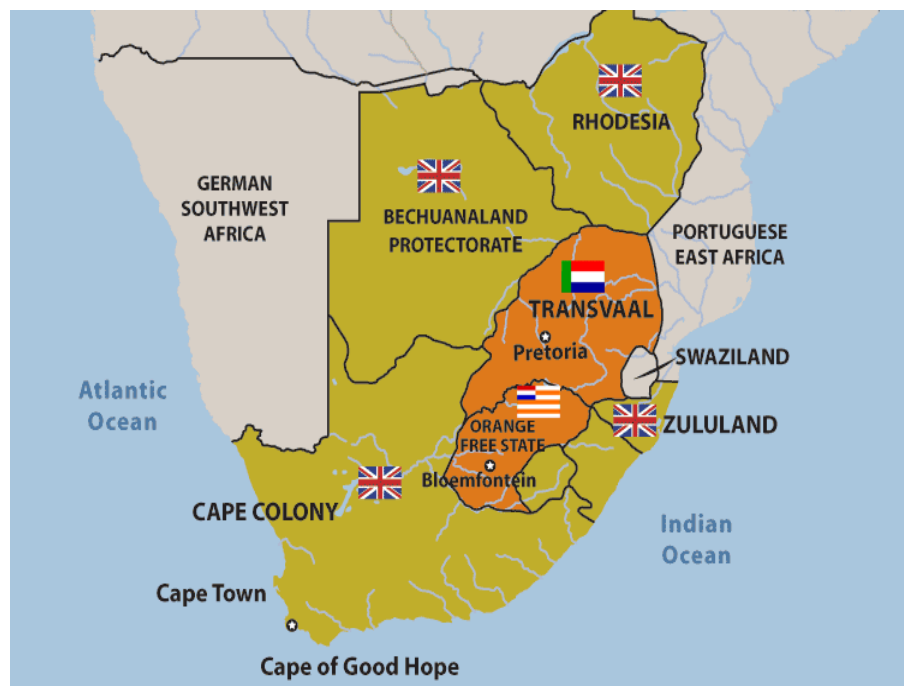
Εικόνα 15. Χάρτης της Ν. Αφρικής που απεικονίζει τις Βρετανικές αποικίες και τις Δημοκρατίες των Μπόερς στα τέλη του 19 ου αιώνα. https://www.warmuseum.ca/cwm/exhibitions/boer/boerwarmaps_e.html#transvaal