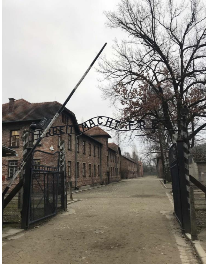
Εικόνα 3. Arbeit Macht Frei (η δουλειά οδηγεί στην ελευθερία). Η γνωστή είσοδος του στρατοπέδου του Άουσβιτς.