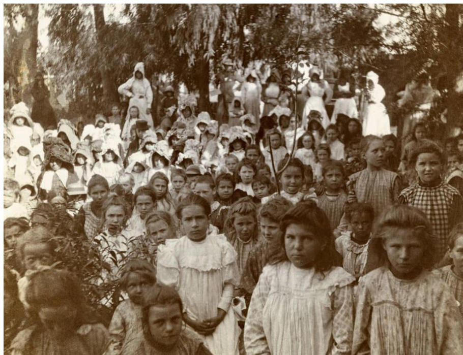
Εικόνα 16. Μπόερς παιδιά μέσα σε ένα στρατόπεδο συγκέντρωσης. Ένα στα τέσσερα δεν θα τα κατάφερναν μέχρι το τέλος του πολέμου. NylstroomCamp, Νότια Αφρική, 1901.