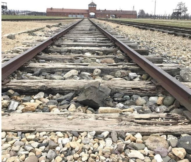
Εικόνα 5. Στο βάρος, Μπίρκεναου.