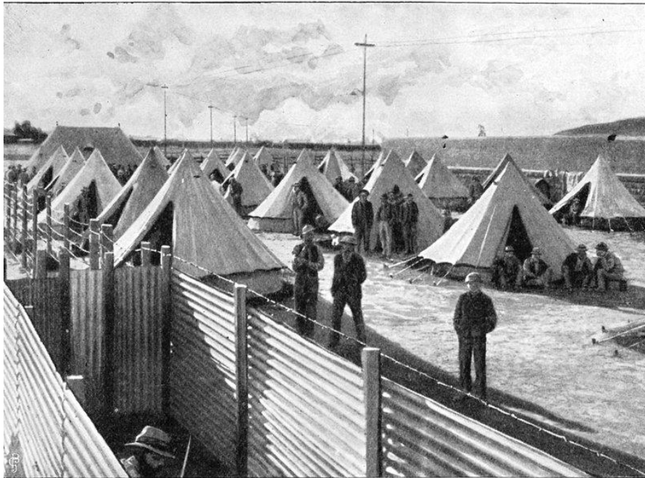
Εικόνα 14. Μπόερς κρατούμενοι σε στρατόπεδο συγκέντρωσης στο Bloemfontein στη διάρκεια του Β' πολέμου των Μπόερς, 1899-1902.