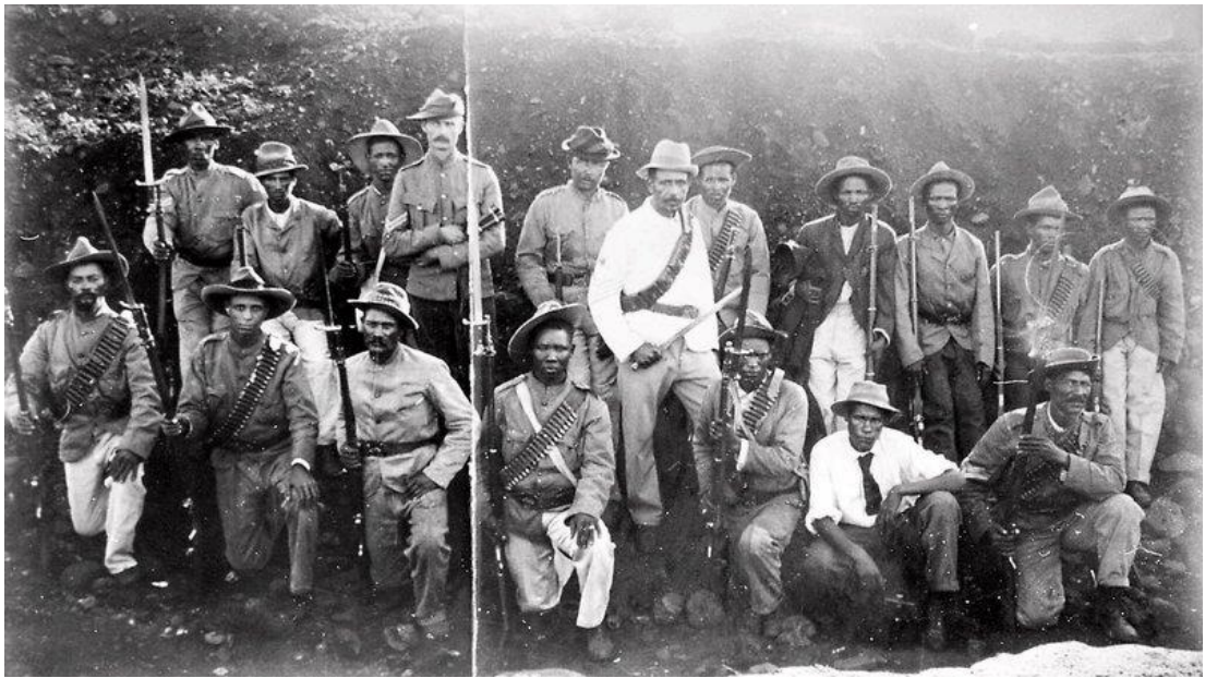
Εικόνα 17. Μαύροι στρατιώτες στη διάρκεια του Β' πολέμου των Μπόερς στην πόλη Mafeking, Νότια Αφρική. Στη διάρκεια του πολέμου αυτού, οι Βρετανοί είχαν δημιουργήσει στρατόπεδα συγκέντρωσης, χωριστά από τα άλλα, για τους μαύρους στρατιώτες. Υπολογίζεται ότι 20,000 με 25,000 μαύροι αιχμάλωτοι πολέμου πέθαναν σε αυτά.