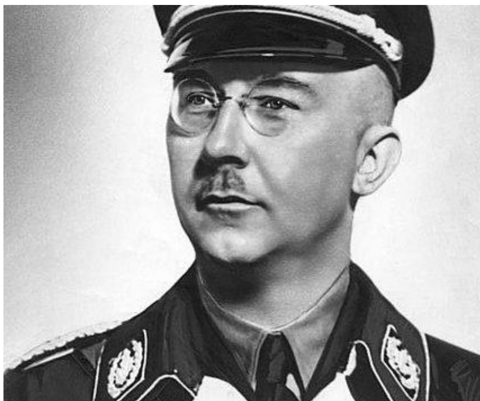
Εικόνα 2. Ο Χάϊνριχ Χίμλερ. Διοικητής των στρατοπέδων συγκέντρωσης του Β' Παγκοσμίου Πολέμου και ηθικός αυτουργός του Ολοκαυτώματος.