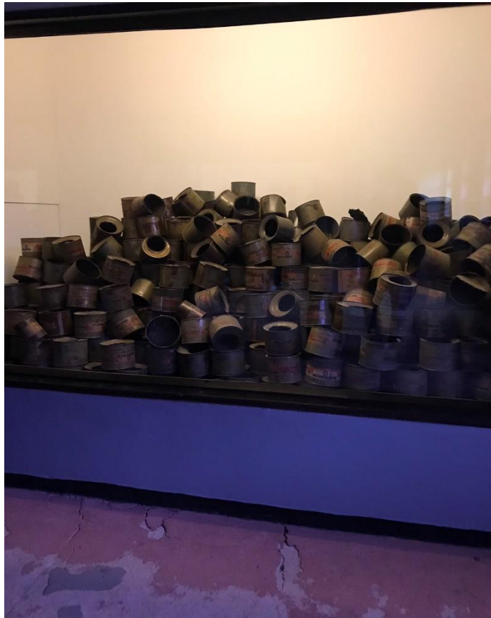
Εικόνα 7. Μεταλλικά δοχεία που περιείχαν τα θανατηφόρα αέρια.