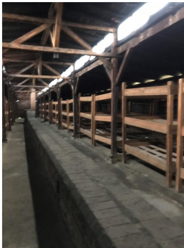
Εικόνα 12. Κουκέτες των κρατουμένων του Άουσβιτς.