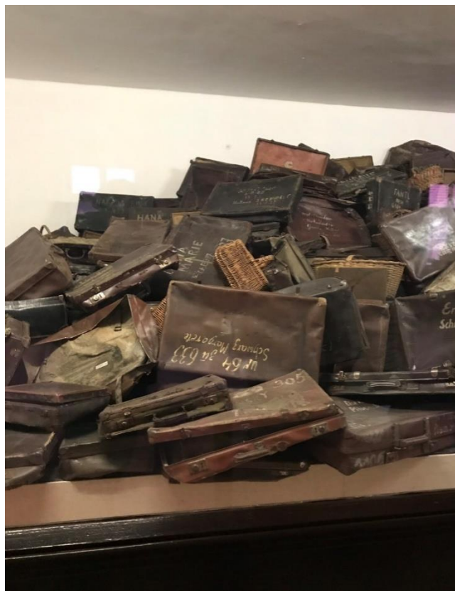
Εικόνα 8. Προσωπικά αντικείμενα ανθρώπων που έφθασαν μέχρι το Άουσβιτς.