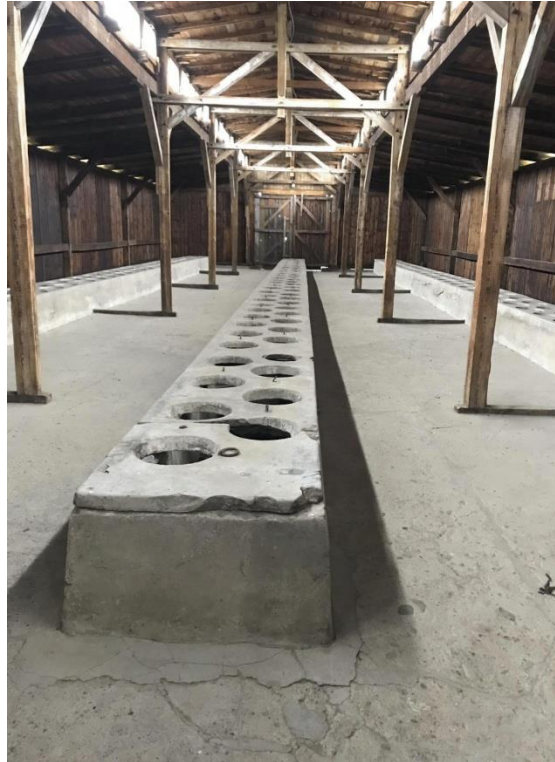
Εικόνα 11. Ομαδικές τουαλέτες κρατουμένων του Άουσβιτς.