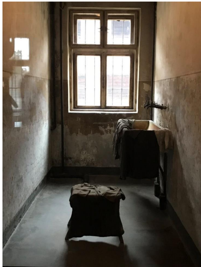
Εικόνα 10. Το μπάνιο των αξιωματικών του στρατοπέδου του Άουσβιτς.