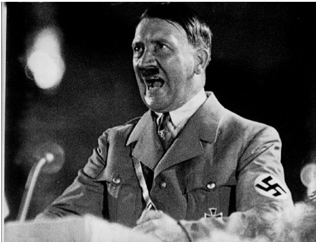
Εικόνα 1. Αδόλφος Χίτλερ. Καγκελάριος της Γερμανίας (1933-1945).