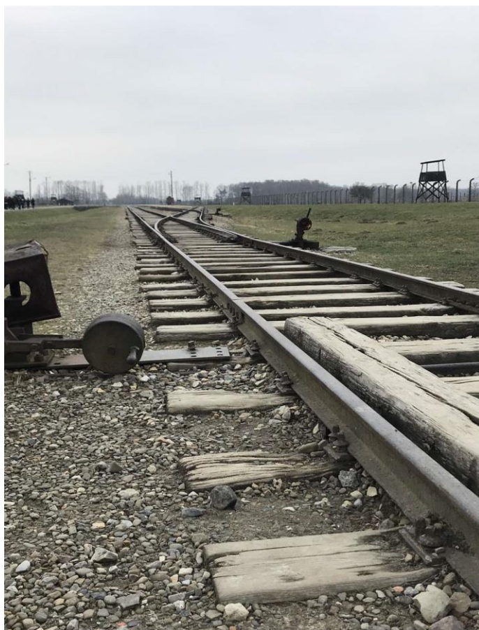
Εικόνα 6. Μέρος από το σιδηροδρομικό δίκτυο που συνδέει τα στρατόπεδα του Άουσβιτς.