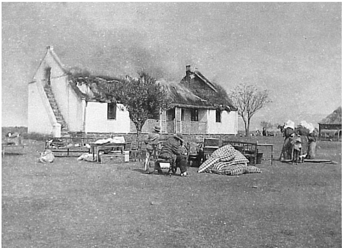
Εικόνα 18. Απεικόνιση Βρετανικής τακτικής καμένης γης. Σκοπός η άρνηση βοήθειας προς τους Μπόερς κομάντο-πολεμιστές. Σε αυτή τη φωτογραφία απεικονίζονται Μπόερς, οι οποίοι βλέπουν τη φάρμα τους κατεστραμμένη και το σπίτι τους τυλιγμένο στις φλόγες.