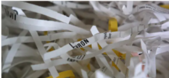
Εικόνα 5.1: NYTimes: A Push to Fix the Fix on Wall Street.