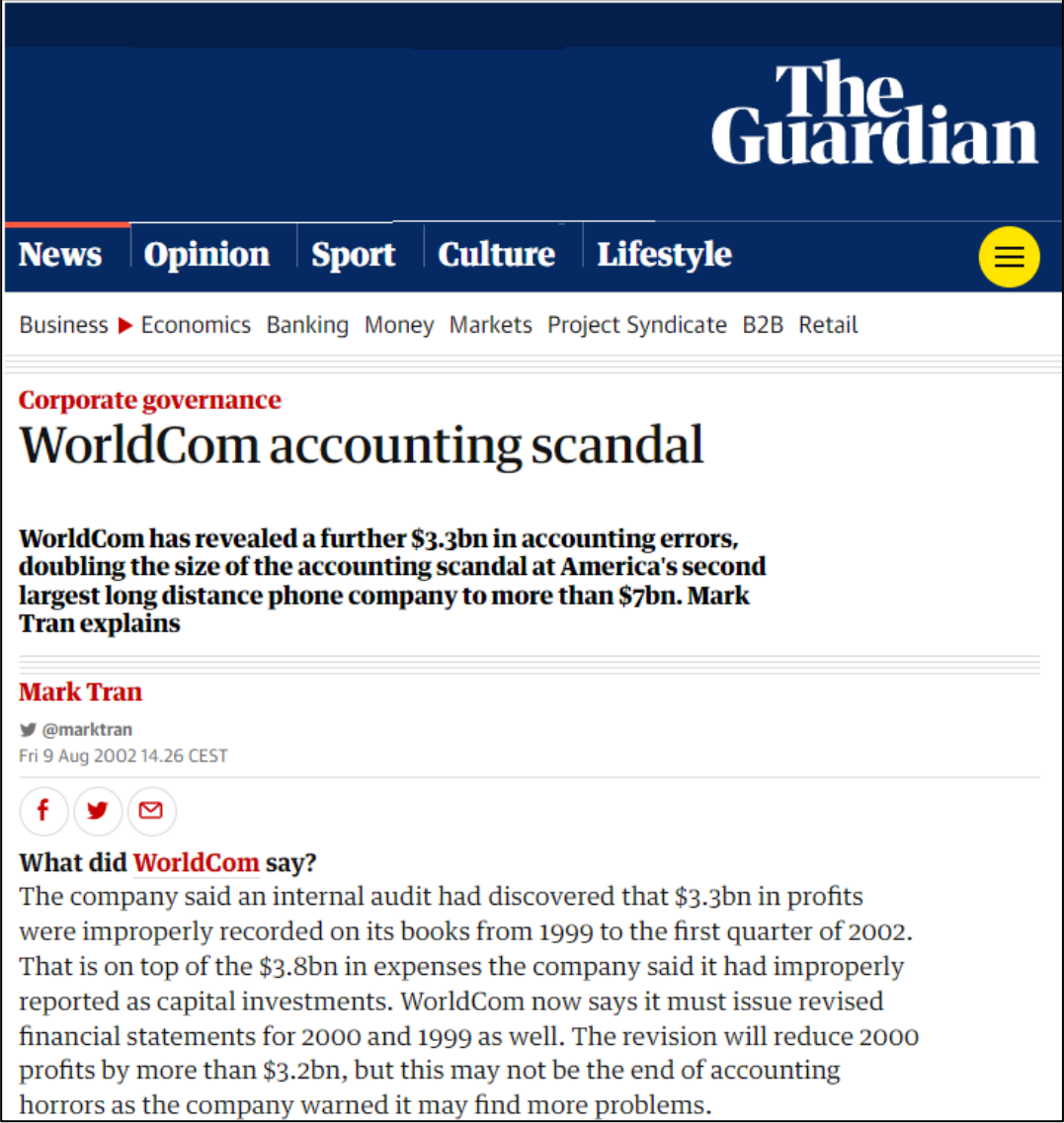
Εικόνα 5.3: Guardian: WorldCom accounting scandal.

https://www.theguardian.com/business/2002/aug/09/corporatefraud.worldcom2