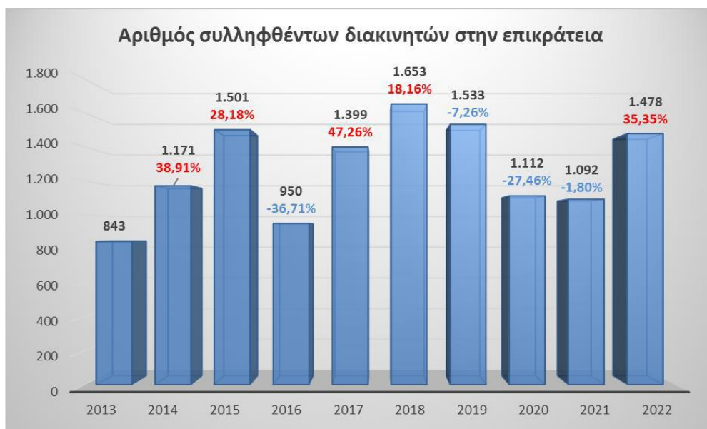
Εικόνα 3: Αριθμός Συλληφθέντων Διακινητών στην Ελληνική Επικράτεια, 2013-2022