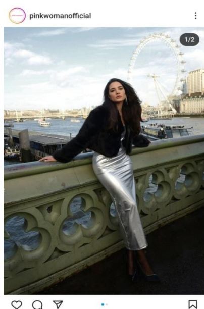
Εικόνα 1: ανάρτηση Instagram

Για αρχή, βλέποντας τις απαντήσεις των συμμετεχόντων παρατηρείται ότι πράγματι η εταιρεία του λιανικού εμπορίου, PinkWoman, σε σελίδα της στο Instagram εφαρμόζει τις τεχνικές που ανέφεραν οι συμμετέχοντες, δηλαδή την περίοδο των γιορτών Χριστούγεννα-Πρωτοχρονιά, σε ανάρτηση τους σε αυτή τη πλατφόρμα ανέβασαν μια φωτογραφία μιας κοπέλας που φοράει ένα γιορτινό φόρεμα συνδυαστικά με ένα πανωφόρι. Στη σελίδα της στο Instagram, χρησιμοποιεί την τεχνική της προσωποποίησης που είναι μια τεχνική που επικεντρώνεται στην προσαρμογή των μηνυμάτων μάρκετινγκ ώστε να ανταποκρίνονται στις ανάγκες, τις προτιμήσεις και τα ενδιαφέροντα των καταναλωτών (Αντωνιάδης, 2013). Η βασική ιδέα είναι ότι οι άνθρωποι είναι πιο πιθανό να ανταποκριθούν όταν λαμβάνουν μηνύματα που είναι σχετικά, έγκαιρα και εξατομικευμένα. Για παράδειγμα, η Pink Woman χρησιμοποιεί την προσωποποίηση, στο Instagram για να παρουσιάσει πώς οι πελάτες μπορούν να διαμορφώσουν τα ρούχα τους για περιστάσεις όπως οι γιορτές των Χριστουγέννων και της Πρωτοχρονιάς. Με αυτόν τον τρόπο η εταιρεία στοχεύει να δημιουργήσει μια σύνδεση, με τους πελάτες της να τους εμπνεύσει και τελικά να τους πείσει να κάνουν αγορές.