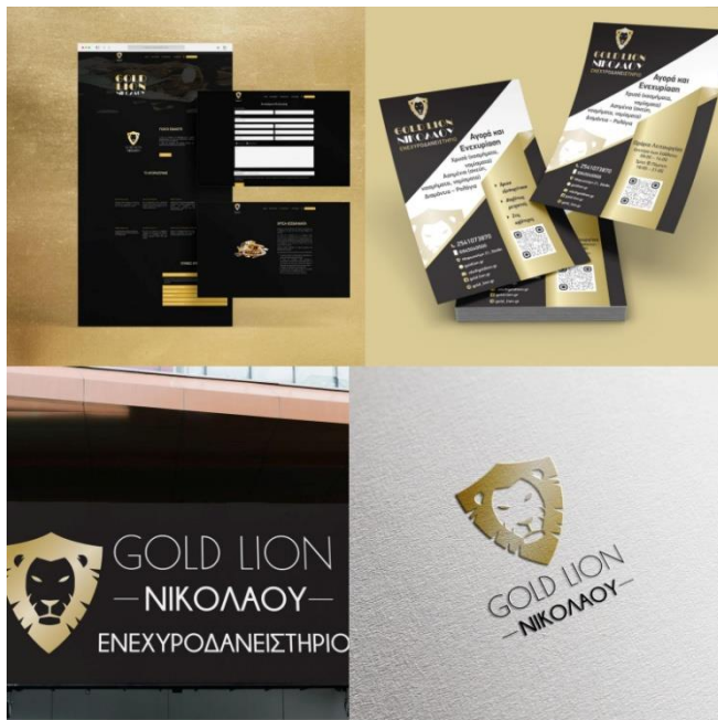
Εικόνα 2: Ανάρτηση για πελάτη

Στη συνέχεια, η εταιρεία μάρκετινγκ, 2KProject, μέσω δικής της ανάρτησης και αυτή στη σελίδα της στο Instagram ανήρτησε για λογαριασμό πελάτη της τα διαφημιστικά φυλλάδια, το logo και το site της εταιρείας που δημιούργησε. Εδώ παρατηρείται πως χρησιμοποιήθηκαν λίγα χρώματα, δηλαδή το μαύρο, το χρυσό και το λευκό. Επίσης, η γραμματοσειρά που χρησιμοποιήθηκε είναι απλή και λιτή. Επομένως, κρίνοντας από τις απαντήσεις που έδωσαν οι συμμετέχοντες της εταιρείας παραπάνω, θέλησαν να δώσουν μια «πολυτέλεια» (βλ.παράρτημα ΙΙΙ, απάντηση ερώτησης 6). Βέβαια, σε αντίθεση με την παραπάνω εταιρεία δεν παρατηρείται κάποια συγκεκριμένη τεχνική.