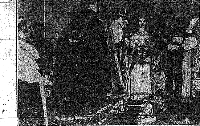
Είς την «Εκδήσει των Ίδωδων Σπείδω»... Η εκδήσει των Ίδωδων Σπείδω, η οποία είναι η προσωποποίηση της νίκης...