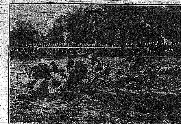
Είς το Χαυδ Πάρκ του Λουδίνου, πέπτε τμήματα Εθελούλων του Ουασιόνστερ μετέχον...