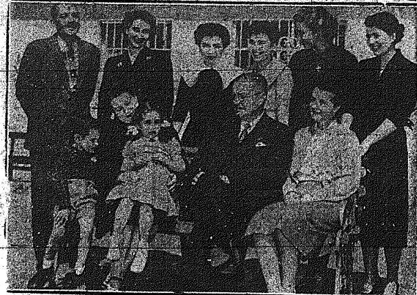
Ο νέος Πρόεδρος της Χιλής, Κάρλος Πινσόνι, με την οικογένειά του, την Κυριακή 18 Οκτωβρίου, στο λιμάνι της Βαλπαράϊσο.