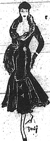
Μοντέλο τού Μπουν. Φούρα από...